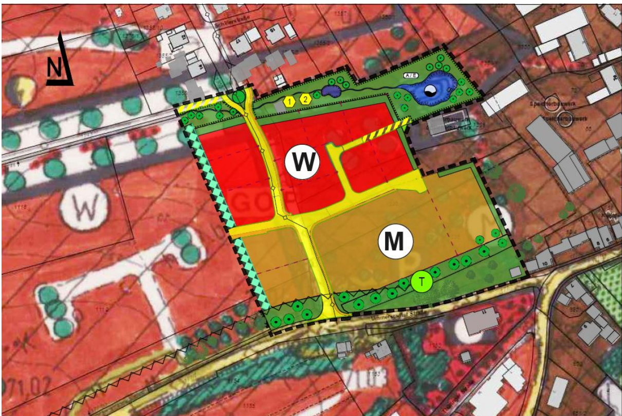
Lageplanausschnitt der geplanten 11. Änderung des Flächennutzungsplanes